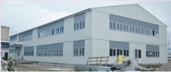
Şubat başında biten ama hava koşulları nedeniyle çevre düzenlemesi yapılamadığı için hizmete alamadığımız Öğrenim Ünitesi

Öğrenim Ünitesi'nin açılışı ve yurt binasının temel atma töreni için 24 Mart günü Van'dayız.