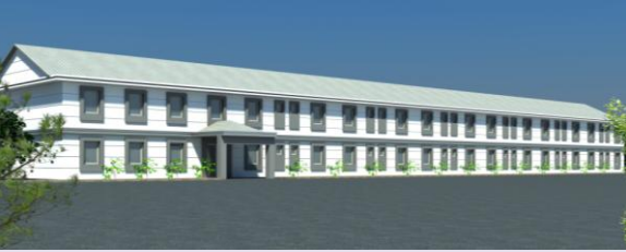
Yeniden projelendirdiğimiz yurt binasının görünüşü

'Dayanışma İçin Caz' Konseri ile 17.300 TL destek sağlandı.